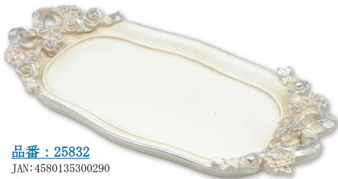
品番：25832 JAN:4580135300290 トレイ W28/D14/H3.5 本体価格¥2,200 カートン入数12