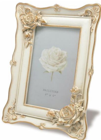
品番：25833 JAN:4580135300306 フォトフレーム W17/D3/H22 (フォトサイズ10×15) 本体価格¥1,600 カートン入数18