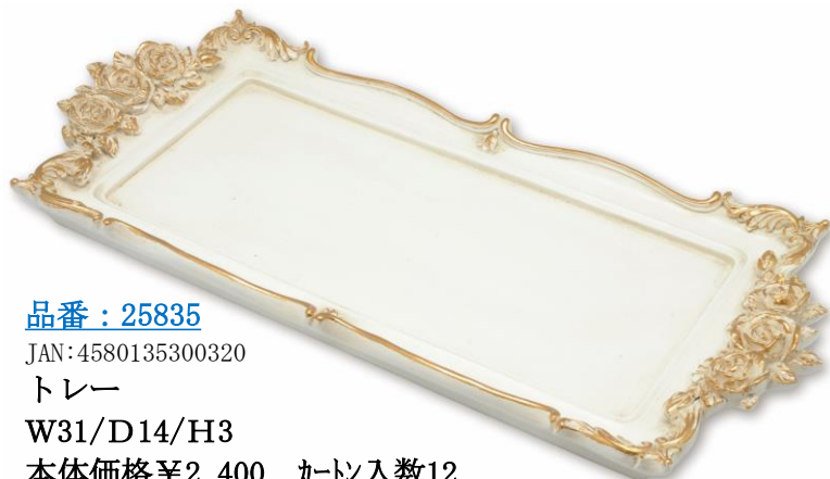
品番：25835 JAN:4580135300320 トレイ W31/D14/H3 本体価格¥2,400 カートン入数12