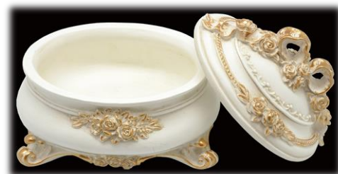
品番：25829 JAN:4580135300269 オーバル小物入れ W12.5/D10/H10.5 本体価格¥2,200 カートン入数12