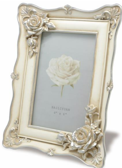
品番：25834 JAN:4580135300313 フォトフレーム W17/D3/H22 (フォトサイズ10×15) 本体価格¥1,600 カートン入数18