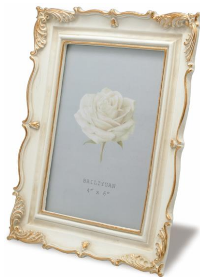
品番：25837 JAN:4580135300344 フォトフレーム W15/D2.5/H20 (フォトサイズ10×15) 本体価格¥1,600 カートン入数18