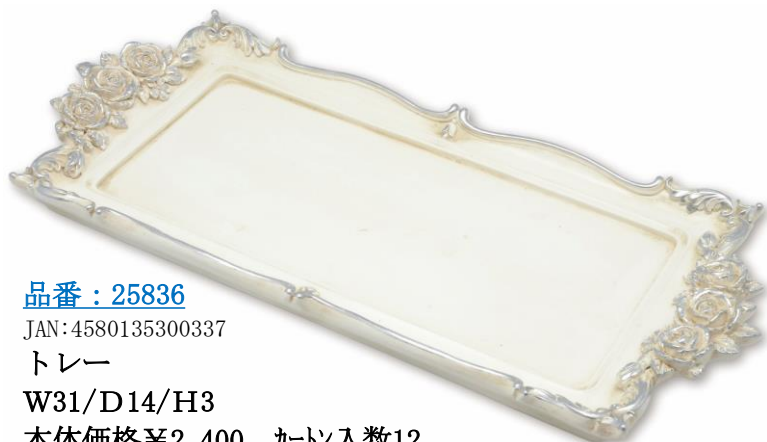
品番：25836 JAN:4580135300337 トレイ W31/D14/H3 本体価格¥2,400 カートン入数12