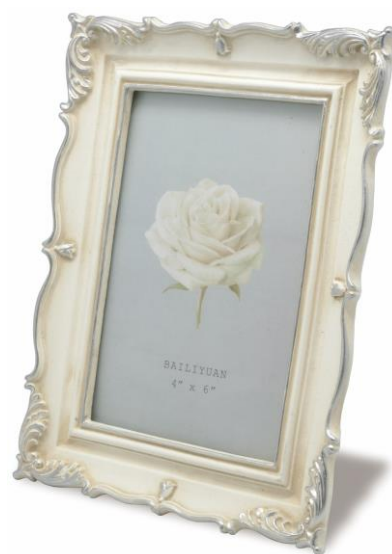
品番：25838 JAN:4580135300351 フォトフレーム W15/D2.5/H20 (フォトサイズ10×15) 本体価格¥1,600 カートン入数18