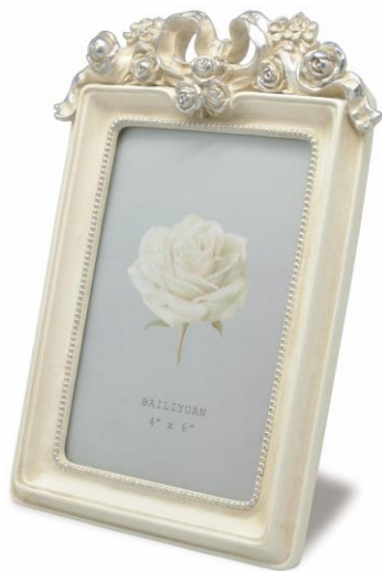
品番：25828 JAN:4580135300252 フォトフレーム W15.5/D2.5/H21 (フォトサイズ10×15) 本体価格¥1,600 カートン入数18