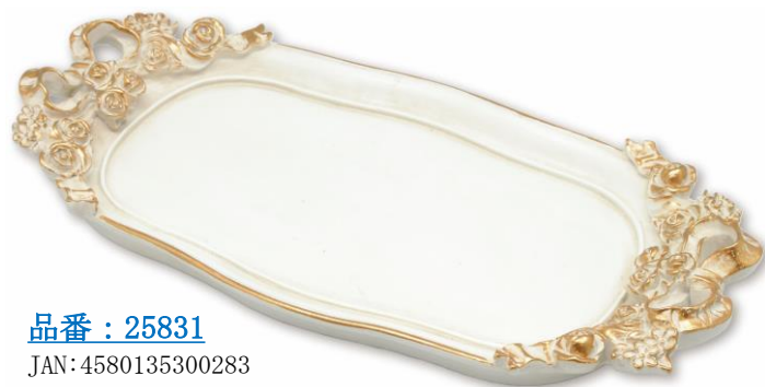
品番：25831 JAN:4580135300283 トレイ W28/D14/H3.5 本体価格¥2,200 カートン入数12