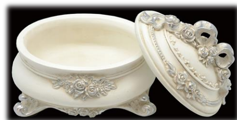
品番：25830 JAN:4580135300276 オーバル小物入れ W12.5/D10/H10.5 本体価格¥2,200 カートン入数12