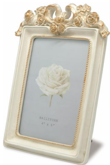
品番：25827 JAN:4580135300245 フォトフレーム W15.5/D2.5/H21 (フォトサイズ10×15) 本体価格¥1,600 カートン入数18